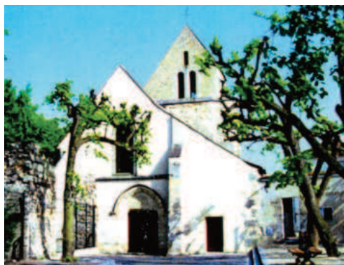
Maisons-Laffitte, l'ancienne église

Elle a été désaffectée par la suite. Mais néanmoins inscrite à l'inventaire des Monuments historiques en 1926.